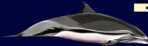
Dauphin de Fraser Fraser's dolphin