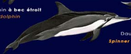
Dauphin à long bec Spinner dolphin