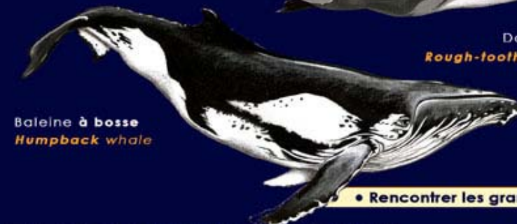
Baleine à bosse Humpback whale