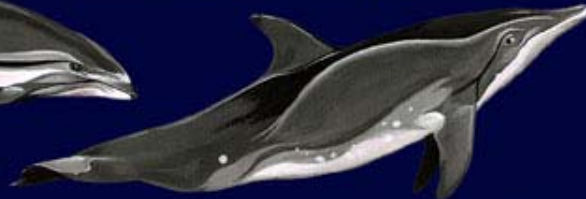
Dauphin à bec étroit Rough-toothed dolphin